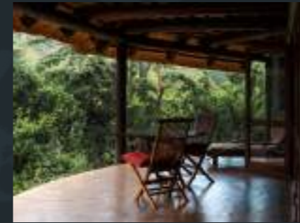
Schéma Directeur National du Tourisme, Lesotho

Conception graphique et communication visuelle