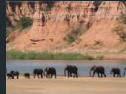
Schéma Directeur National du Tourisme, Zimbabwe

La Stratégie de Réduction de la Pauvreté reconnaît que pour mieux utiliser sa beauté naturelle et ses infrastructures existantes, le Lesotho doit attirer davantage de touristes. Dans ce contexte, la Banque Africaine de Développement assiste le Gouvernement dans le cadre du Projet de soutien à la diversification économique. L'une des actions du programme consiste à renforcer l'environnement politique et la capacité de diversification économique. L'objectif général était de renforcer le cadre juridique et d'améliorer la planification et la gestion des destinations touristiques. Les activités se sont développées en plusieurs étapes, à savoir un diagnostic pour évaluer le potentiel touristique du pays, la révision du cadre juridique (Politique Nationale du Tourisme et Loi sur le Tourisme) et la préparation du schéma directeur du tourisme. Ce dernier a été complété par six plans de développement des zones touristiques et un plan d'action global pour une mise en œuvre efficace.